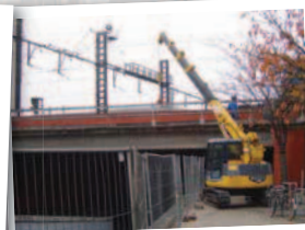
Travaux de levage variés