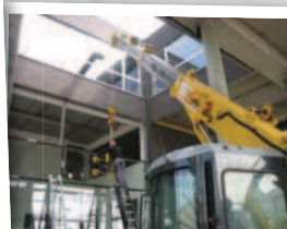
Pose de vitrages